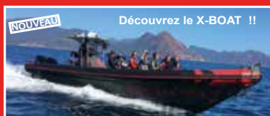
Découvrez le X-BOAT !!

ADULTE : 39 € ENFANT : 28 € (8 à 16 ans)