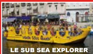
LE SUB SEA EXPLORER