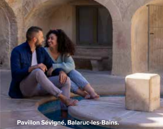
Pavillon Sévigné, Balaruc-les-Bains.