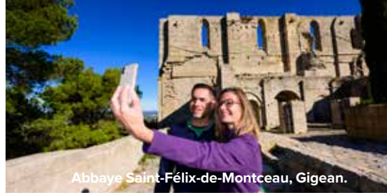
Abbaye Saint-Félix-de-Montceau, Gigean.